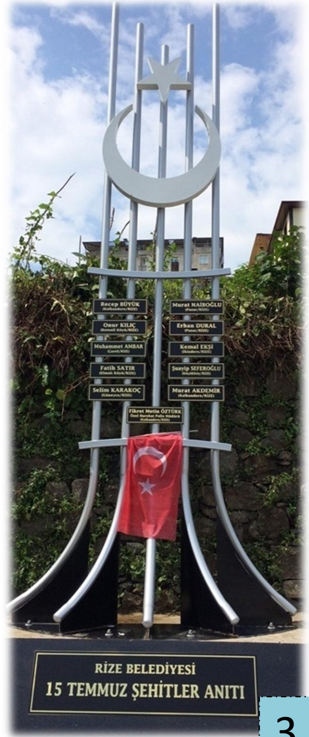
RİZE BELEDİYESİ 15 TEMMUZ ŞEHİTLER ANITI